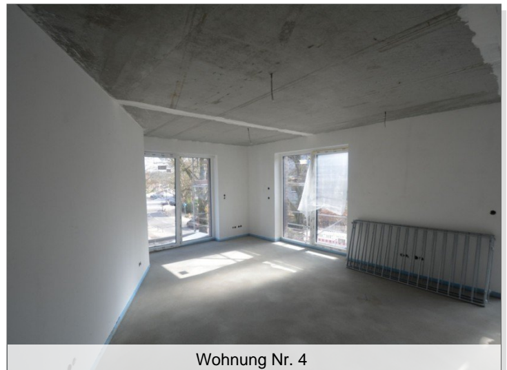
Wohnung Nr. 4