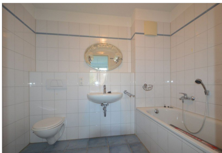
Bad en Suite