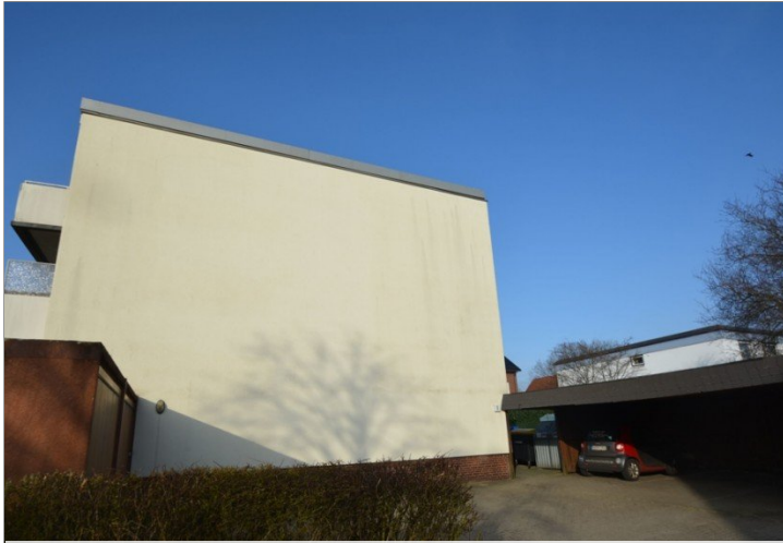
Hausansicht und Carport