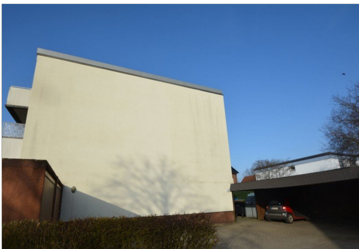
Hausansicht und Carport