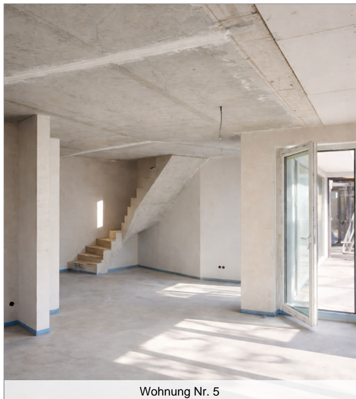
Wohnung Nr. 5