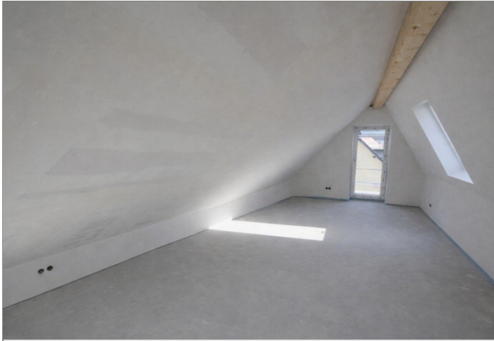
Wohnung Nr. 5