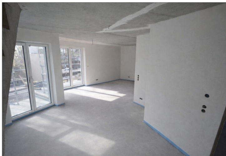
Wohnung Nr. 5