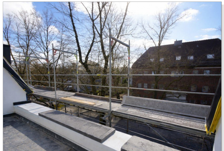
Wohnung Nr. 5