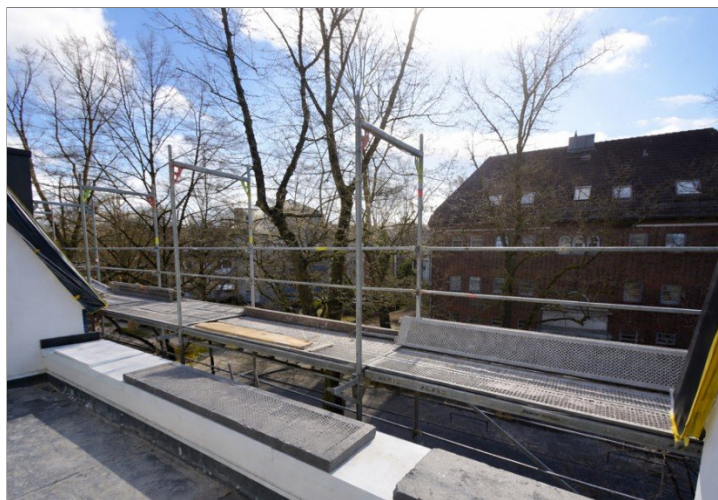
Wohnung Nr. 5