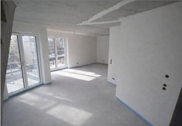
Wohnung Nr. 5