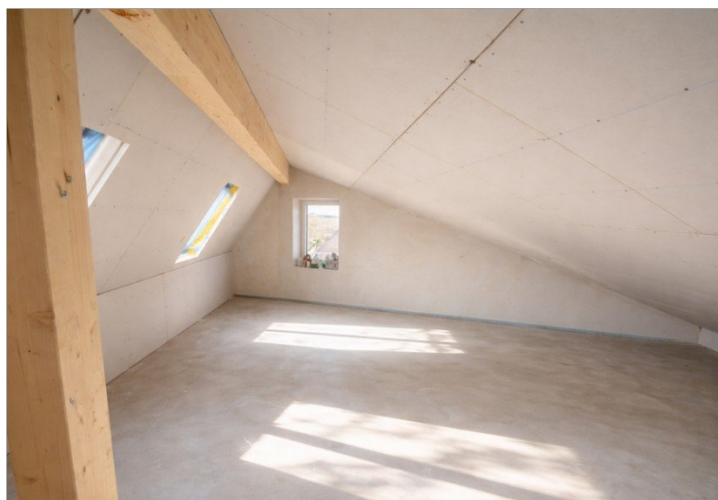
Wohnung Nr. 5