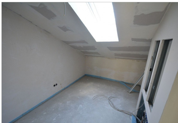
Wohnung Nr. 5