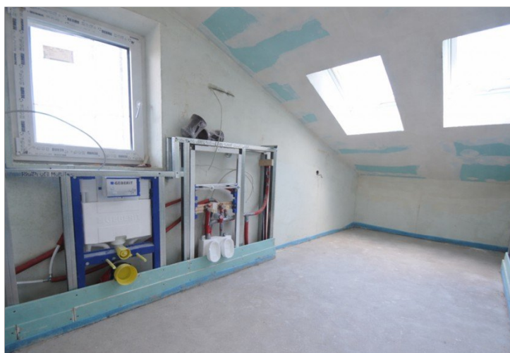
Wohnung Nr. 5