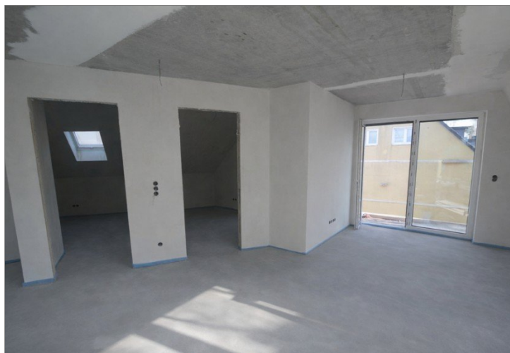
Wohnung Nr. 6