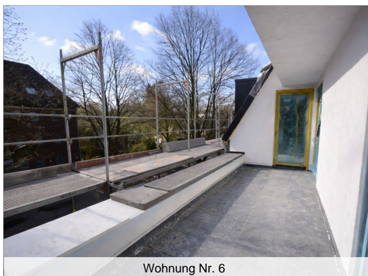
Wohnung Nr. 6