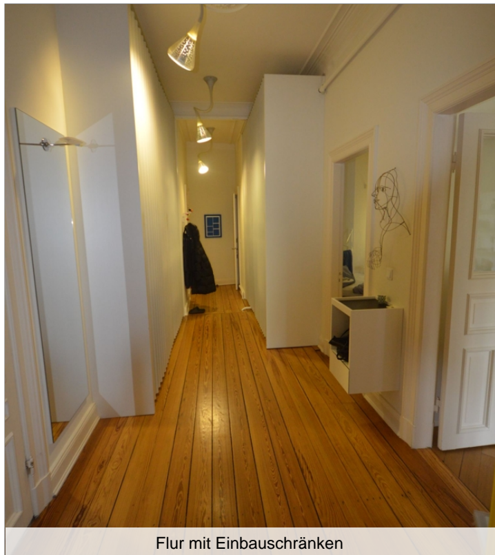
Flur mit Einbauschränken